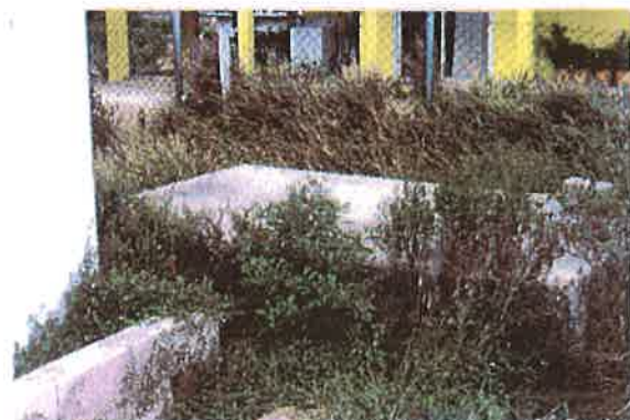
Woonhuis te Macuarima # 131-C